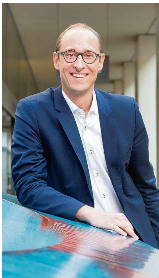
L'ascensiu dal podest presidial è in emprindissadi da dus onns.

Be il manaschi dal parlament cun tut las tematikas è natiralmain fitg bain enconuschent a mai suenter 10 onns en il Cussegl naziunal. En il