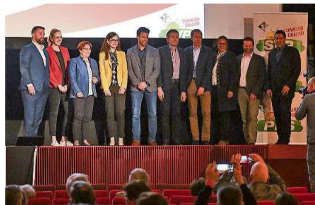
Las candidatas ed ils candidats da la PPS che van en cursa tar las elecziuns dal cussegl nazional da quest atun – en occasiun da la radunanza da delegads da gievgia a Cuira.