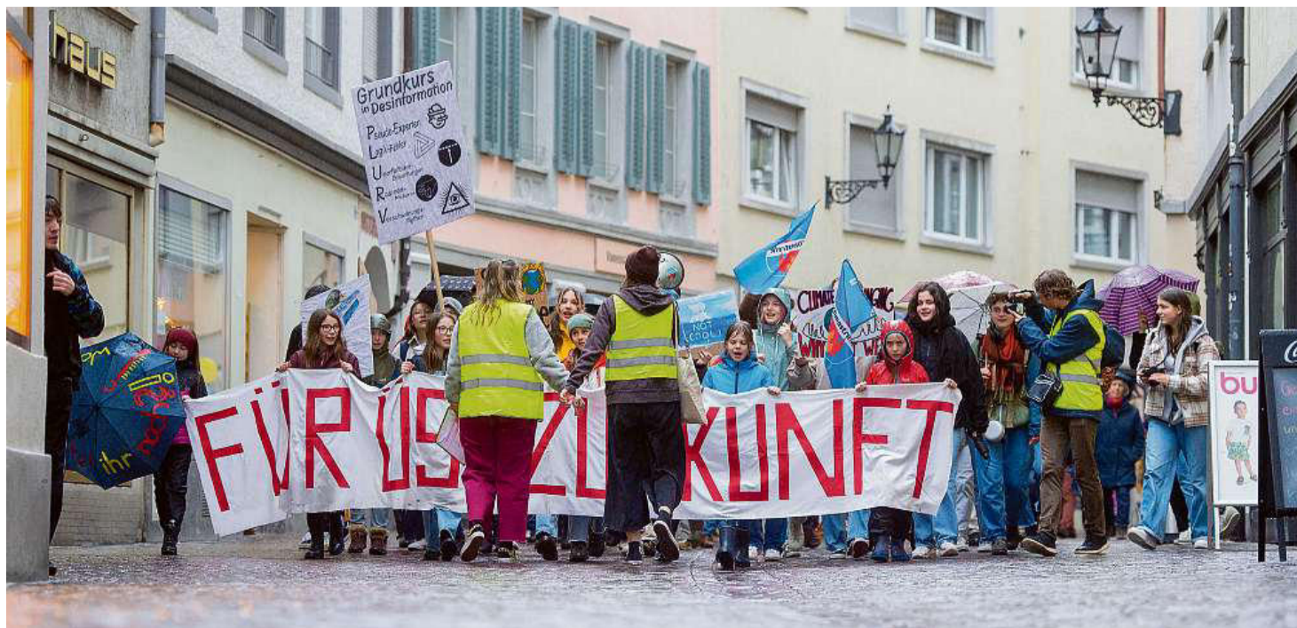
Ina tschientina da persunas èn sa participadas venderdi a la demonstraziun per il clima tras la citad veglia da Cuira.

Render visibla la dischinfurmaziun e crititgar quella – quai è stà il motto da la quarta demonstraziun dal moviment dal clima a Cuira. Venderdi passà èn sa radunadas var 100 demonstrants e demonstrants tar il Alexanderplatz, sco che l'organisatura «Klimademo» ha scrit sonda en ina comunicaziun a las medias. Gist suenter la demonstraziun cun il titel «1,5°» tras la citad veglia da Cuira hai dà en il «Calvensaal» anc ina discussiun da podium davart il tema clima. (cdm/fmr)